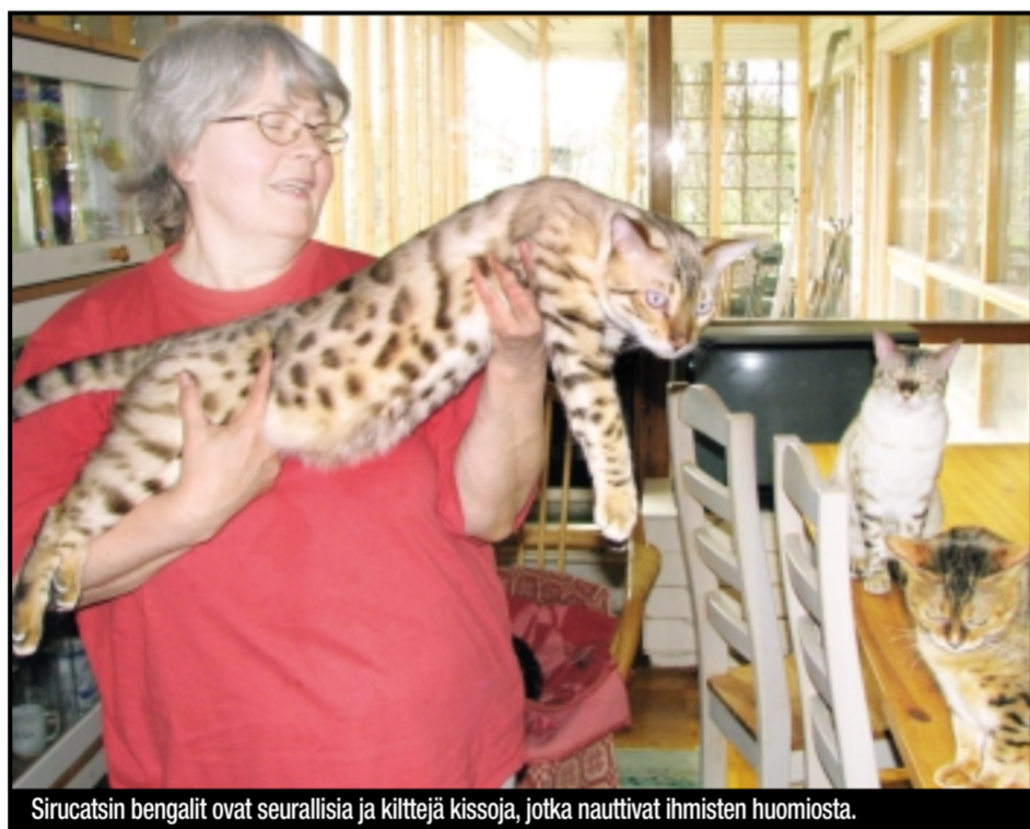
Sirucatsin bengalit ovat seuralaisia ja kilittäjiä kissoja, jotka nauttivat ihmisten huomiosta.