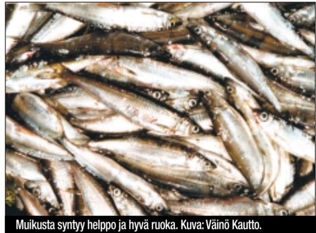
Muikkusta syntyy helppo ja hyvä ruoka.