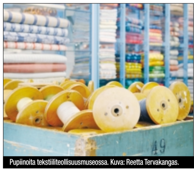
Pupinoita tekstiiliteollisuusmuseossa.